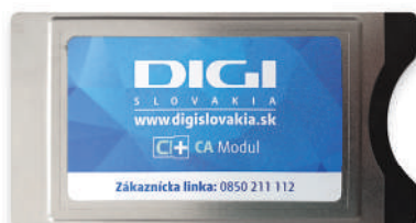
CA modul Nagra